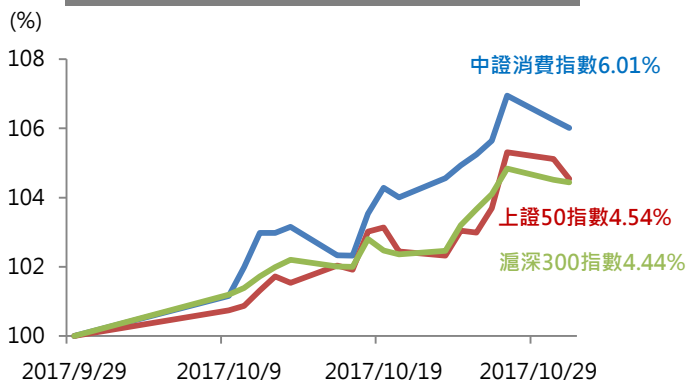
過去一個月中證消費指數走勢圖

資料區期：2017/9/29~10/31，各指數經標準化處理，以2017/9/29為基期100