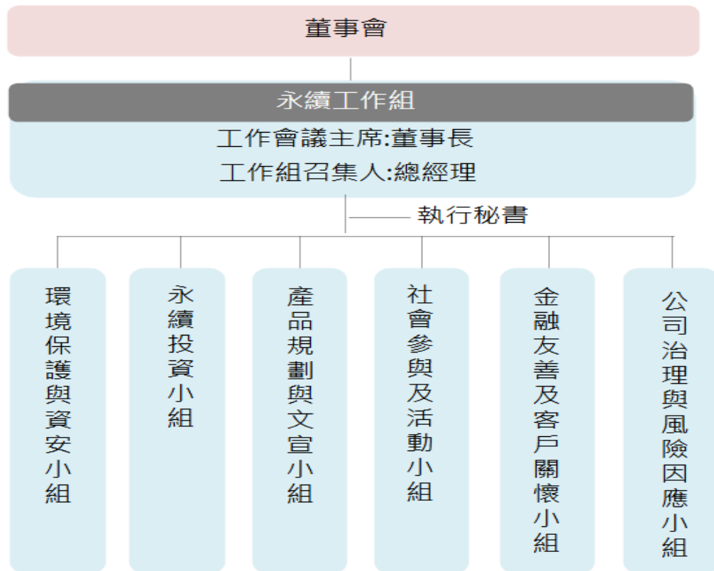
永續功能小組分工圖